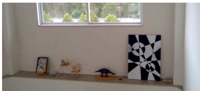
高等部3年生の作品