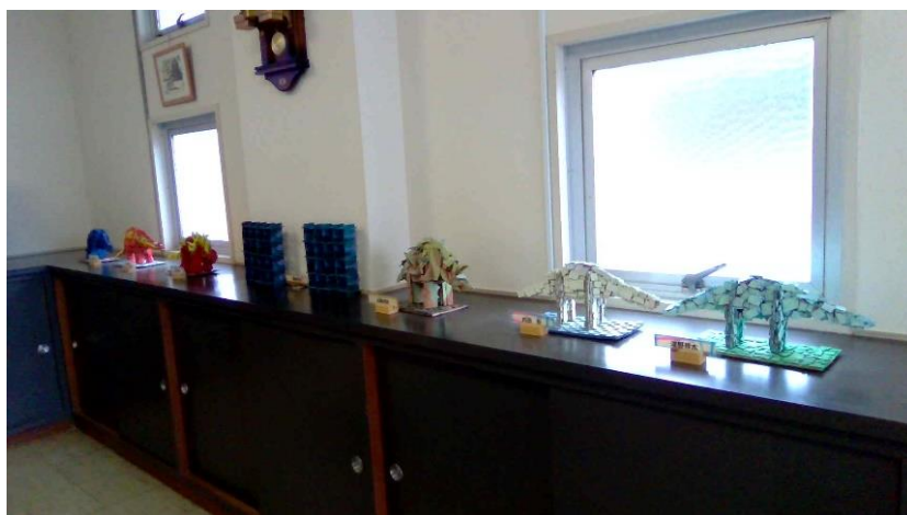
玄関ホールに飾られた造形作品

本校の玄関を入ると、写真のように生徒の美術作品がずらりと並んでいます。この他、校内のいたるところに絵画・造形・デザイン等の作品が展示され、来校された方には、「松ろうアート展」を楽しんでいただくことができます。また、教室棟では、児童生徒の学習の成果物等の掲示をとおして、ろう教育が大切にしている視覚情報の提供の工夫や、言葉を育むための環境づくり等も知っていただく機会となっています。