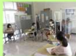
合同自立 ～話し合い活動～

障がいによる学習上や生活上の困難を主体的に改善・克服し、よりよい自立を図るために必要な「きこえ」や「ことば」「社会性」「自己理解」等に関する「自立活動」の授業を行っています。