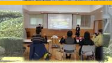
中:古江公民館での手話学習会