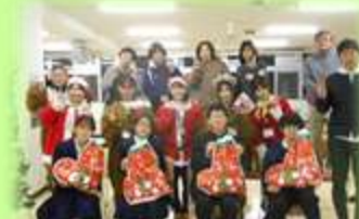
寄宿舍のクリスマス会

通学が困難な場合等には、寄宿舍に入舎することができます。生活時程に沿って規則正しく生活しています。行事は、夏祭り、クリスマス会、お別れ会、校外活動などがあります。また大学生との交流活動も行っています。