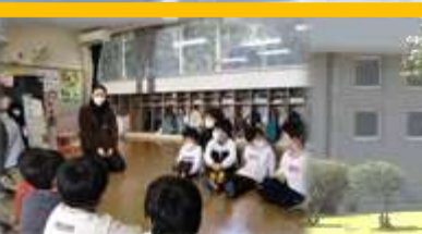
幼:古江幼稚園交流