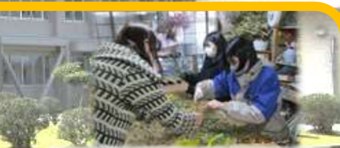
高:ドライフラワーアレンジメント体験