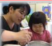
乳幼:親子での活動