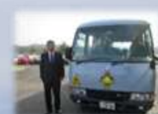
スクールバス 「かきばら号」