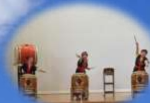
松ろう文化祭 「かきばら祭」