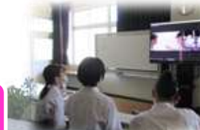
高:島根県立大学生との コラボ会議