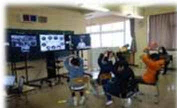
小:他県のろう学校とのリモート交流