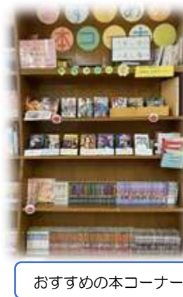
おすすめの本コーナー