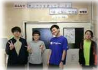
玄関先のお知らせボード